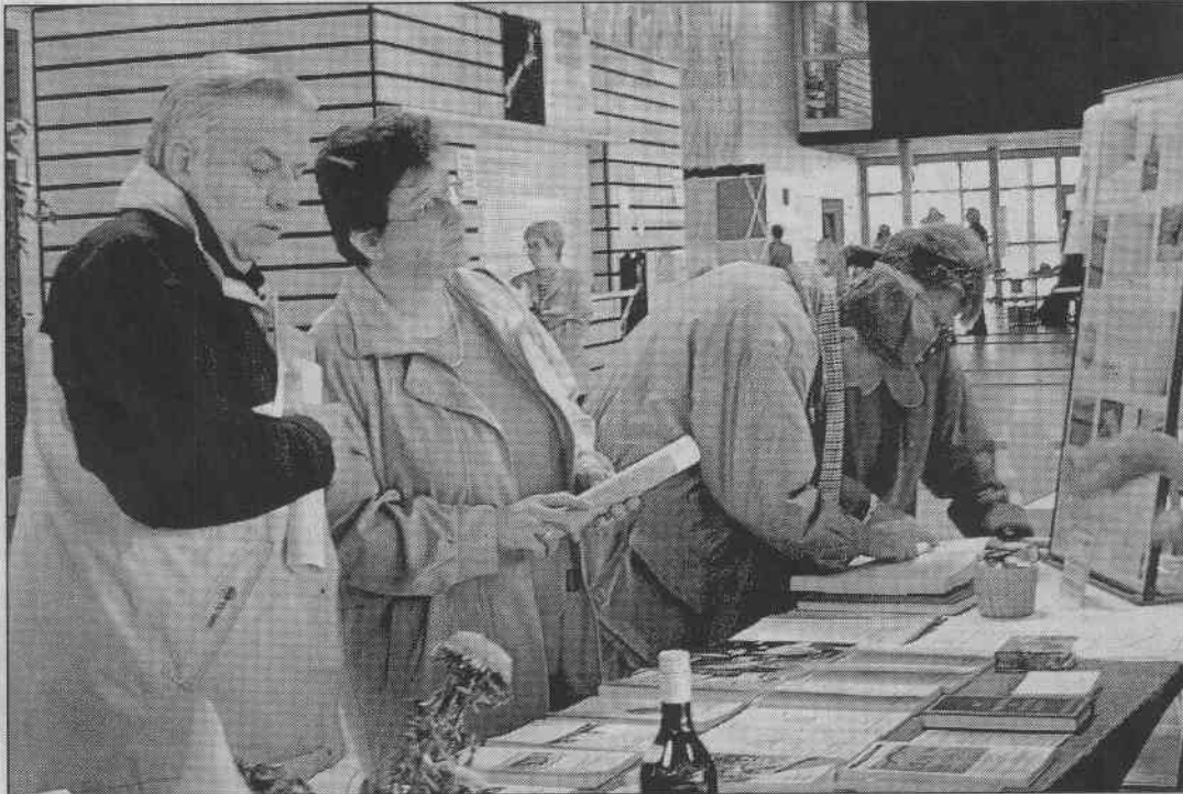
L'exposition sur la généalogie a attiré une foule de spécialistes et de curieux.

Couvet ■ L'exposition «Généalogie à travers le Jura» a connu une belle affluence